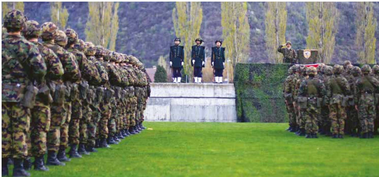
Entre passé et présent, les traditions sont toujours présentes au bat car 1.

Il est un peu moins de 2000 lorsque le crépuscule progresse sur la ville de Sierre. Les compagnies font leur entrée dans l'Amphithéâtre Auguste Piccard - au bord du Lac de Géronde - choisi pour la cérémonie de prise du drapeau. Un cadre magnifique accueille ainsi le bataillon; la météo, incertaine jusqu'alors, se révèle clémente et la température douce. Les nombreux invités et quelques curieux sont au rendez-vous, se tenant en contre-haut d'un demi cercle bordé d'un péristyle arboré. En contrebas, le bataillon, silencieux, s'aligne dans un calme religieux et se tient prêt au début de la cérémonie.